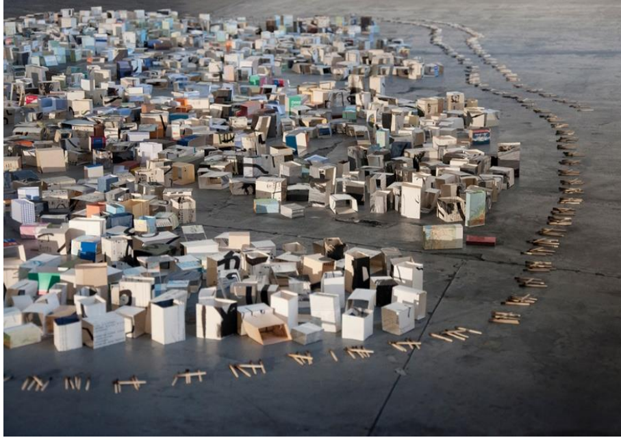
Görsel 5. Issam Kourbaj, Kaybedilen Başka Bir gün, 1,579, Londra civarında 5 lokasyon

Suriyeli çağdaş sanatçı Issam Kourbaj İngiltere’de yaşamını sürdüren zorunlu göçe maruz kalmış sanatçılardan birisidir. Göç, göçmen, barınma ve çocuk olmak gibi temalara dikkat çeker. Bu yerleştirme çalışması, Londra’daki Arap kültürünü anma şenlikleri olan Shubbak festivali sebebiyle, Londra’nın farklı yerlerinde gerçekleştirilmiştir. Farklı kentlerde sergilenen ‘Kaybedilen Başka Bir gün’ isimli yerleştirme çalışmasında, Suriye göçmen sorununa değinmiştir. 2011 yılından itibaren Suriye’de yaşanan savaşa dair çalışmalar üreten sanatçı, bu tür yerleştirme çalışmaları ile insanların mültecilere, göçmenlere yardım etmesini ve destek olmasını teşvik etmeyi amaçlamıştır. Ayrıca bu var olan göç sorunu hakkında insanları bilinçli olmaya da davet etmektedir (Issam Kourbaj..., Alserkal Venue). Sanatçı bu yerleştirme çalışmasında malzeme olarak çeşitli ilaç kutuları, eski kitaplar ve farklı ürün kutuları gibi atık malzemeler kullanmıştır. Eski yıpranmış kitapları birbirinden ayırıp binalardaki tabela algısını izleyiciye hissettirmek için siyah çizgilerle şekillendirerek ve Arapça yazılar ekleyerek bu çalışmasını oluşturmuştur. Çalışmanın çevresini ise yanmış kibrit çöpleri ile çevirmiştir. Bu yanmış kibritler Suriye’deki iç savaşın başlangıcından o güne kadar geçen günlerin sayısını temsil etmektedir (Girgin, 2017).