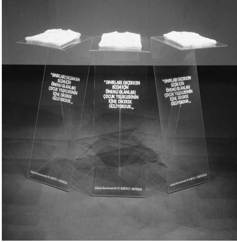
Görsel 6. Gülsün Karamustafa, Kuryeler, 1991, Yerleştirme

Gülsün Karamustafa bu çalışmasını 1991 yılında, yapılan Anı Bellek sergisi için ürettiği bir eserdir. Sanatçı bu çalışmasında, Yugoslavya göçünü ele alarak, zamanında büyükannesinin yaşadıkları anılardan yola çıkmıştır. Belleğinde yer edinmiş izler ve anlatıların ışığında kurguladığı çalışma, büyükannesinin söylediği bir cümleden etkilenerek ortaya çıkmıştır. Büyükannesi biz “Sınırlardan geçerken önemli olan eşyalarımızı, çocuk yeleklerinin içine saklıyorduk” cümlesine yönelik biçimlenmiştir. Sanatçı üç adet çocuk yeleğinin içine şahsına ait önemli gördüğü şeyleri dikmiştir. (Erol, 2020).