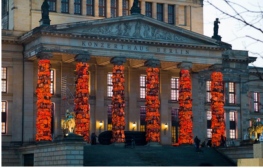
Görsel 2. Ai Weiwei , Güvenli Geçiş, 2016

Ai Weiwei'nin 2016 yılında yaptığı yerleştirme çalışmasında ise Midilli Adası'nda bırakılan binlerce turuncu can yeleğini toplayarak, Berlin Konser Salonu'nun girişindeki kolonların üzerlerini binlerce can yeleğiyle paketlemiştir. Berlin'deki Konzerthaus binasının kolonlarını 14 bin can yeleği ile çeviren Çinli sanatçı Ai Weiwei', yerleştirmesini Viyana'da da gerçekleştirmiştir. Ai Weiwei, geçtiğimiz yıl mültecilerin Avrupa'ya ilk ayak bastıkları noktalardan olan Midilli Adası'na bir stüdyo kurmuştur. Sık sık adayı ziyaret eden Weiwei, mültecilere fotoğraflarını sosyal medya hesaplarından paylaşmıştır. Bu konuda tepkisini belli eden sanatçı, son olarak Danimarka'nın mülteci politikası sebebiyle ülkedeki sergisini iptal etmiştir. (Yılmaz, 2016: https://www.arkitera.com/haber/ai-weiwei-multeci-sorununu-14-000-can-yelegi-ile-gozler-one-serdi )