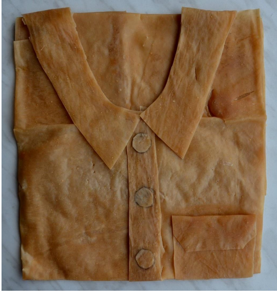
Görsel 8. Seçkin Aydın, Babaannemi Taşıyamam, Ayrıca Onu Ne Yiyebilirim Ne De Giyebilirim, 2015, Yerleştirme/Kostüm

Göç tecrübeleri üzerinden kurgulanarak oluşturulan çalışmalarıyla sanat alanında bilinen çağdaş sanatçı Seçkin Aydın "Babaannemi Taşıyamam, ayrıca onu ne yiyebilirim ne de giyebilirim" diye adlandırdığı pestilden ürettiği kostüm biçimindeki yerleştirme çalışmasında, 1990 sonrasında Türkiye'nin Güneydoğu Bölgesinde gerçekleşen köy boşaltma hükmünün ardından ailesiyle birlikte yaşamlarını sürdürdükleri bölgeye de uygulanmasıyla ilerleyen bir göç hikâyesini sanat yaratımında işlemiştir. Sanatçının bilinçaltında iz bırakan bu göç eylemi, zorunlu bir göç sürecinde yaşanan geçmişten kalan büyük bir şok sonucunda oluşmuş derin bir travmanın bıraktığı izi dışa aktarımının somut bir anlatımıdır. Sanatçının çocukluk çağına ait olan bu göç hikâyesini kendi ifadesiyle şöyle aktarmıştır. "Bir gün, bir gece, bir nehir ve yedi dağ yürüme mesafesindeki bir köye" gidiş sürecini kapsamaktadır. (Aydın, 2015: