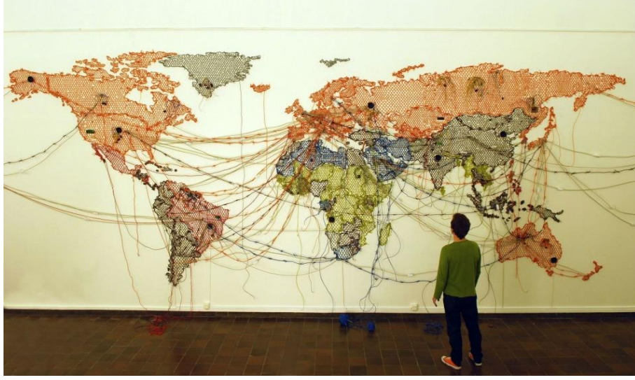
Görsel 3. Reena Saini Kallat, İsimsiz (Harita, Çizim), 2011, Elektrik telleri ve bağlantı parçaları, 10 dk. Sesli döngü

Göç kavramını sanat üretimine dâhil edip dünya haritasını kullanarak gösteren Hintli çağdaş sanatçı Reena Saini Kallat, bu çalışmasını, birbirine bu denli bağlı olunan bir dünyada göç yasaları, kapanan sınırlar, müdahaleler, önyargılar, yaptırımlar ve sınırları geçmek isteyen insanların maruz kaldığı zorlukları harita metaforunu kullanarak gerçekleştirmiştir. Sanatçı dünyanın her bölgesinde gerçekleşen küresel sorun haline gelen göç hareketini, elektrik kabloları ile göstermiştir. Elektrik akışı ile ifade edilen bu döngüde bir yerden ayrılmanın yanı sıra göçün sebep olduğu farklı kültürlerle etkileşim de söz konusudur.