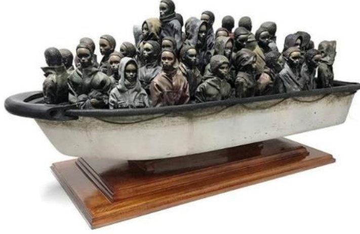
Görsel 1. Banksy, "Mülteci Teknesi", Yerleştirme, 2016

Kimliğini açıklamayan sokak sanatçısı, film yönetmeni ve ressam Banksy, bu çalışmasında mülteci sorununa değinmiştir. Sanatçı, İngiltere’de terk edilmiş, eski bir spor merkezini geçici sergi alanına çevirmiştir. Weston-super-Mare tatil kasabasında büyükler için bir eğlence parkı olarak düzenlenen ‘Dismaland’ adlı bu sergide eserler, bolca toplum eleştirisi içerdiğinden Banksy bu alanı “küçük çocuklar için müsait olmayan aile eğlence parkı” diye tanımlamıştır. Dikkat çeken bu eserde kalabalık mülteci botların yüzdüğü ve içerisinde ceset dolu bir gölet dikkat çekmektedir. Banksy’e ait olduğu düşünülen sergide en çok üzerinde konuşulan iş olan mülteci teknesi adlı yerleştirme çalışması insanlara büyük rahatsızlık vererek, sıradanlaştırılan insanları bize göstermektedir. Ayrıca sanatçı Dismaland sergisinde bulunan mülteci teknelerinden birini sosyal medya hesabından satışa çıkarıp, satıştan elde edilen tüm geliri mülteciler için bağışlanacağını söylemiştir. (Banksyden, 2018: https://www.artkolik.net/haber/banksyden-sosyal-medya-cekilisi-2682 )